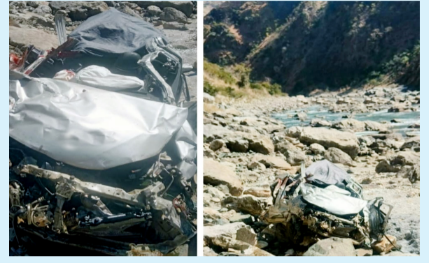
(UK07DU-4719) त्यूणी से अटाल की ओर जा रही थी। कार में एक ही सात लोग सवार थे। परिवार सैंज गांव से चालदा महासू महाराज के दर्शन के लिए जा आ रहा था। डूंग

जानकारी के अनुसार, हादसा दोपहर के समय हुआ। आल्टो