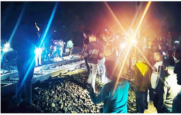
के लिए रवाना हो रहा हूँ। मैंने इसके लिए जिम्मेदार लोगों की पहचान करने के निर्देश दिए हैं। हम इस मुद्दे को

इस बीच जामताड़ा के विधायक इरफान अंसारी ने बताया कि इस घटना में करीब तीन लोगों की मृत्यु हुई है और कई लोग लापता हैं। ऐसी सूचना मुझे मिली है। ये दुःखद घटना है। मैं मौके