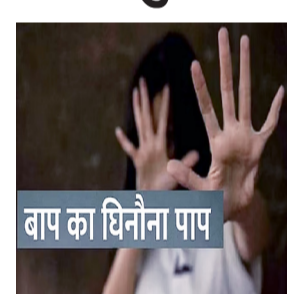
बाप का धिनीना पाप

उपाध्याय ने बताया कि शहीद नगर निवासी महिला की ओर से साहिबाबाद थाने पर तहरीर दी गई। महिला ने बताया कि एक स्कूल में घरेलू नौकरानी का